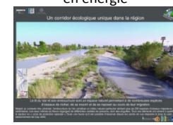
Un corridor écologique unique dans la région

Un outil pédagogique élaboré par le CRDP de l'académie de Nice en partenariat avec Nice Côte d'Azur et le Conseil Général des Alpes-Maritimes, la LPO et l'université de Nice-Sophia Antipolis et l'académie de Nice.