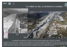
La vallée du Var, un territoire en mutation