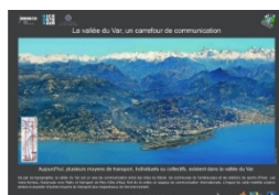
La vallée du Var, un carrefour de communication