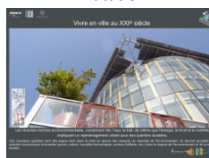
Vivre en ville au XXI e siècle