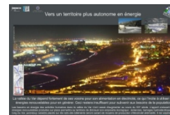
Vers un territoire plus autonome en énergie