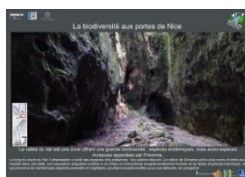
La biodiversité aux portes de Nice