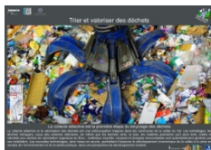
Trier et valoriser les déchets