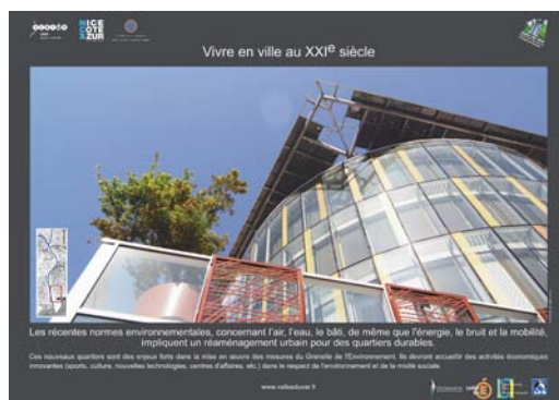
◀ Inauguration de l'opération (17 février 2012)