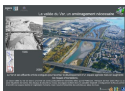
La vallée du Var, un aménagement nécessaire

Le CRDP de l'académie de Nice édite pour toutes les écoles et établissements situés sur cette zone géographique une série de onze posters pour sensibiliser les élèves aux problématiques du développement durable dans la vallée du Var et fournir aux enseignants des pistes pédagogiques et des supports adaptés à leurs niveaux d'enseignement. Cette série de photographies, destinée à être exposée en classe et exploitée par les enseignants est enrichie de ressources pédagogiques disponibles en ligne . ( www.valleeduvar.fr )